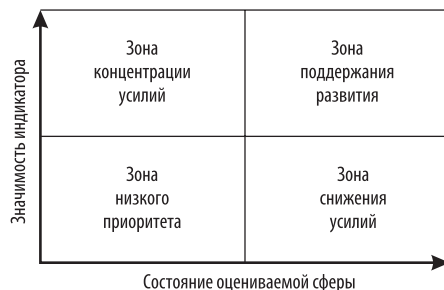
Рис. 1. Оценка баллов для показателей

Гражданам рассматриваемого региона предлагается оценить данный перечень социальных индикаторов по значимости при принятии решения о выборе места жительства и по состоянию сферы, оцениваемой данным индикатором в данном регионе. Для оценки используется 7-балльная шкала. По результатам опроса для каждого социального индикатора рассчитывается совокупный балл и составляется матрица, представленная на рис. 1.